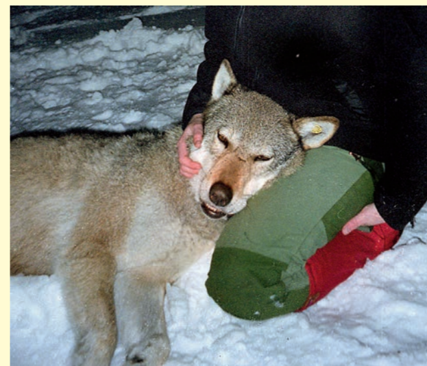
Hannulven i Mangen-paret under merkingen i 2003.

Oppropet som er gjengitt til venstre kom redaksjonen i hende her om dagen, og det er liten tvil om hva slags holdninger odølingene bak dette representerer. Det er for så vidt greit nok at enkelte velger å ta slike innsamlingsinitiativer. Det er jo fritt opp til slike mennesker å gi uttrykk for den forvirring som til en hver tid hersker i deres hoder. Det som imidlertid gjør denne saken spesiell er at man ønsker bidra økonomisk til dekning av bøter for folk som straffes for forsøk på særlig grusomme avlivingsmetoder . Utlegging av gift kan dessuten medføre andre konsekvenser som disse personene åpenbart ikke har noen som helst tanke for. Initiativtagerne skriver dessuten at «vi er mange» som er uenig med rovviltforvaltningen og «vi» ønsker å vise støtte på denne måten. Det er åpenbart at disse menneskene føler at de representerer bygdefolket generelt. Det taler i så fall ikke til fordel for bygdefolket at de ser seg tjent med den slags talerør. Men nå tror jo ikke FVR at det er tilfelle – et blikk på meningsmålinger i rovviltsaken gir et helt annet bilde. Men problemet er at man faktisk lar disse representere seg når det enten ties over hele linjen eller når f.eks. fremtredende kommunerepresentanter uttrykker forståelse for lignende tildragelser.