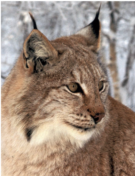
Gaupe i innhegning.

Stadig høy aktivitet i fylkeslaget i Østfold