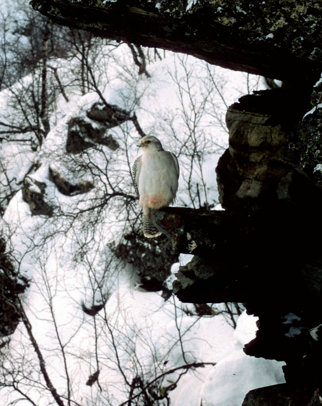
Hvit jaktfalkhann i nærheten av hekkeplassen i Finnmark i 2003.

I Finnmark skjedde det også store ting i 2003 da Arve Østlyngen holdt en hekkende hvit jaktfalkhann, for ikke å si en «grønlandsfalk», under oppsikt fra januar til ungene forlot reiret i juli. Det som tidligere hadde vært en uoppnåelig drøm for enhver rovfuglentusiast, ble plutselig virkelighet på norsk jord. Her ble det gjort banebrytende observasjoner av blant annet paringer midt i januar! Maken var en 3-årig tradisjonell grå skandinavisk hunn, og hekkingen resulterte i 4 «vanlige» unger, helt ulik sin lyse far. Dette reiser spørsmålet om hvitfalken var en innvanderer eller om det i den skandinaviske genpoolen finnes anlegg som bare en sjelden gang manifesterer seg i lyse individer?