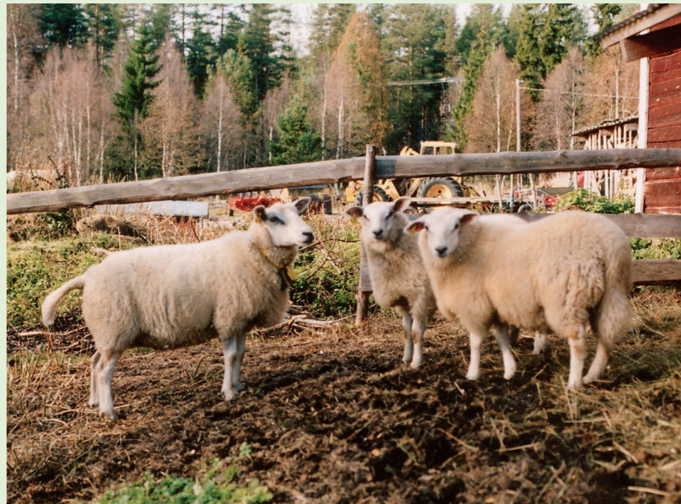
Familieidyll i nytt land.

gjennfunn av sau som står fast i snøen langt ut på vinteren, blir redningsaksjonen mer eller mindre fremstilt som en barmhjertighetens dåd (hvilket forsåvidt kan være berettiget). Men det som pressen «glemmer» er den manglende dåd ved en driftsform som fører til at dyrene ikke kommer til gards i rimelig tid.