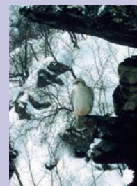
Forsidefoto: Hvit jaktfalk- hann i Finn- mark 2003.