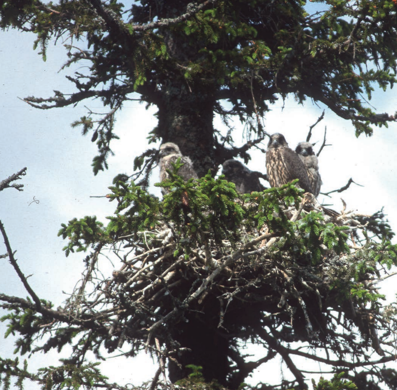
Over: Jaktfalkreiret med de fire ungene.