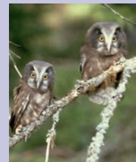
Baksidfoto: Perleugleunger ved Ørbekken, Elverum, mai 1981.