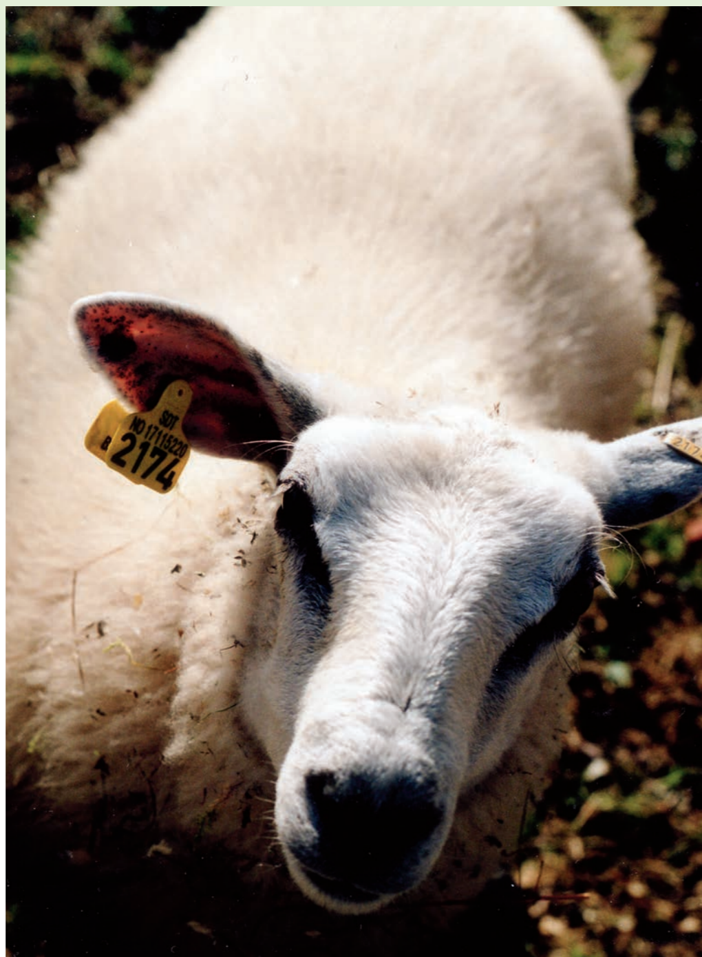
ID-kortet var i orden.

Er så dette et enkeltstående tilfelle? Slett ikke. Det finnes fra før eksempler på at norsk sau på fritt utmarksbeite har vandret over store avstander, både på langs og på tvers av riksgrensen. Slike vandringer gir grunn for refleksjoner. Når en sau ikke blir funnet i beiteområdet om høsten, må man altså regne med at dyret kan befinne seg hvor som helst innenfor en radius på minst 17 mil, hvilket representerer et areal på nærmere 10.000 kvadratkilometer! Med de store og ofte ubebodde områder vi har, ikke minst på svensk side av grensen, sier det seg selv at det blir de reneste tilfeldigheter om slike dyr kommer til rette. Om dette vitner da også de årlige funn av sau som går ute om vinteren og som i enkelte tilfeller holder seg i live like til påsketider. Det er påtagende hvor liten vekt det blir lagt på dette forhold når det gjelder de dyrevernmessige aspekter ved driftsformen i norsk sauehold. Når pressen forteller om