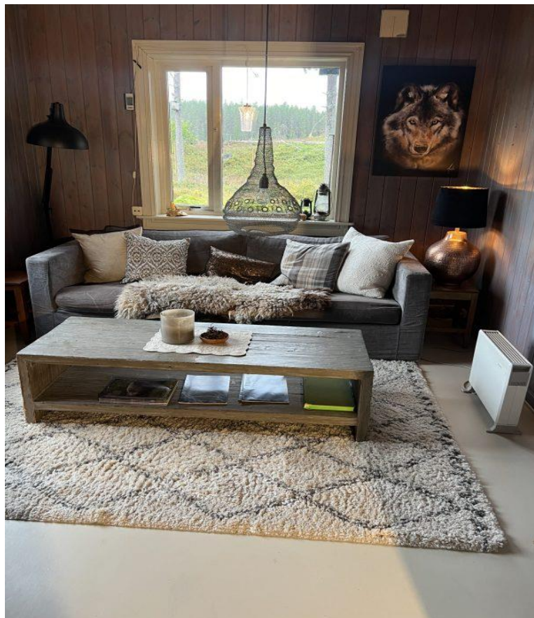
Stua på Haugen etter oppussingen i 2024.

Haugen ble pusset opp i 2024 og fremstår nå som veldig lun og trivelig. I 2025 har utleie av hytten gjennom Airbnb gitt foreningen kr. 42 655 i inntjening.